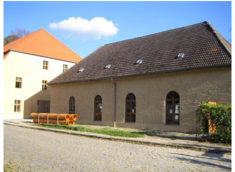
Neu verputzt und gestrichen: Mönchmühle und Saal (Oktober 2013)