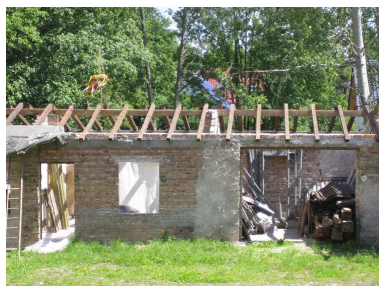
Blick auf den neuen Dachstuhl.

Nach Fertigstellung des Dachstuhls der Remise will der Verein versuchen, das gesamte Gebäude bis zum Mühlenbecker Mönchmühlenfest in diesem Jahr fertig zu stellen. Der erforderliche Bauablauf kann im Infozentrum eingesehen werden.